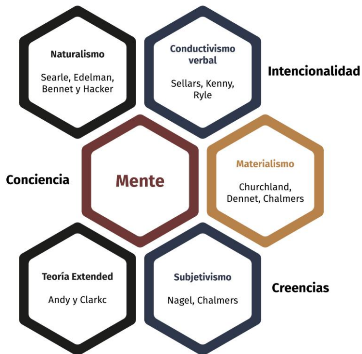
Figura 1. Ruta de aprendizaje.