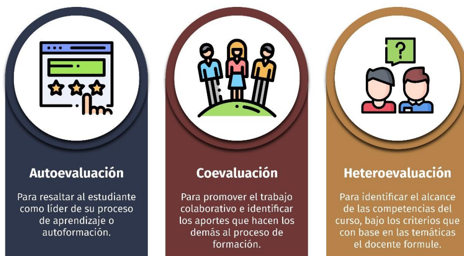
Figura 2. Tipos de evaluación. Elaboración propia.

La evaluación del curso se apoya en los tres tipos clásicos de la evaluación: