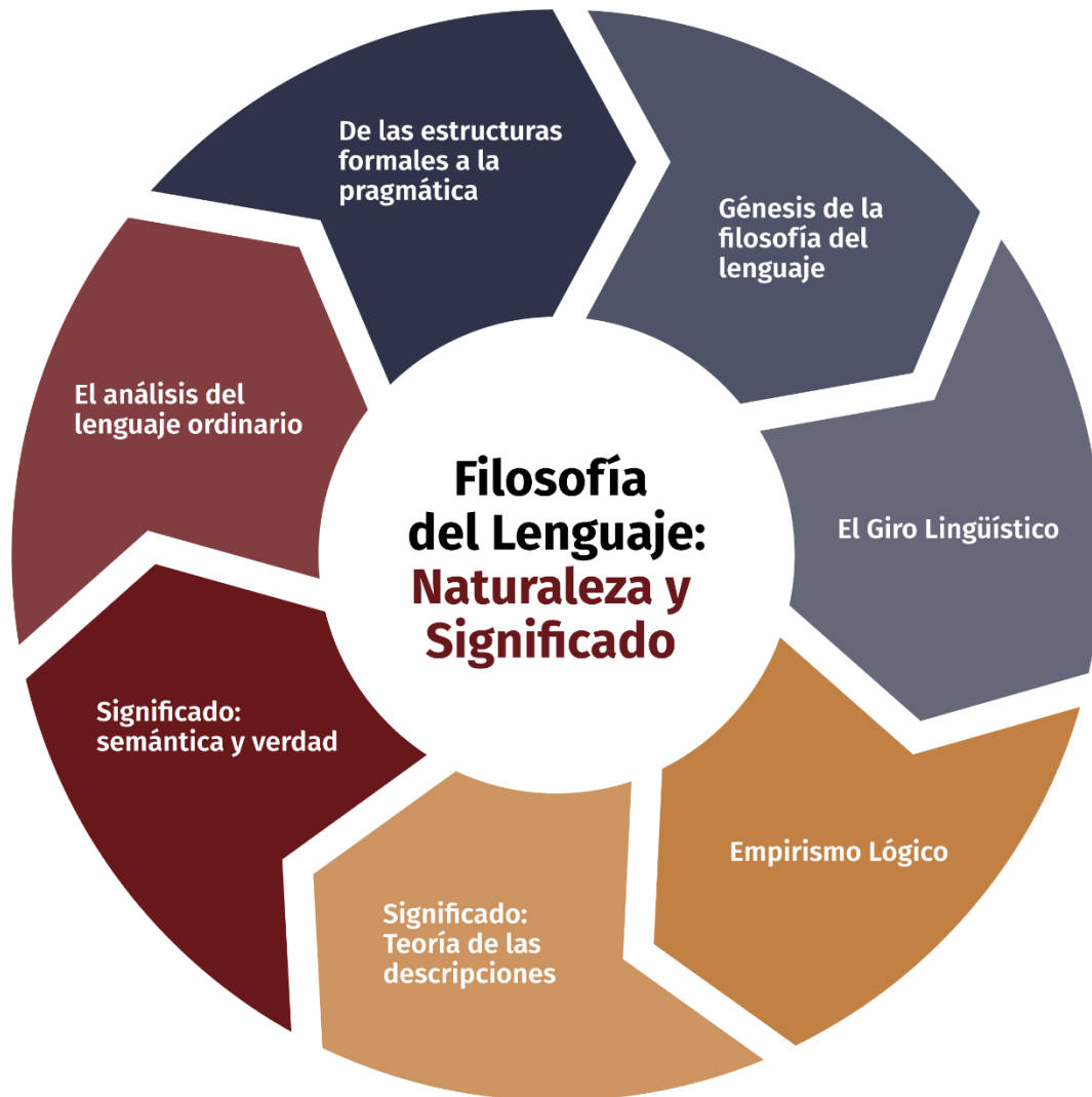
Figura 1. Ruta de aprendizaje. Filosofía del lenguaje: naturaleza y significado.