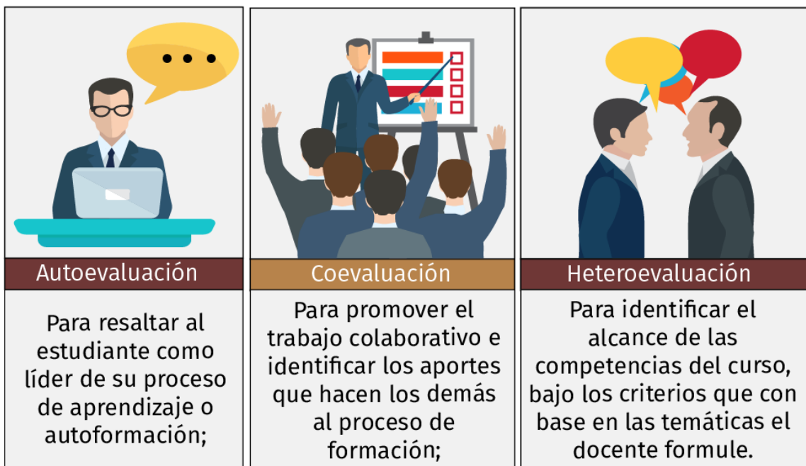
Figura 2. Tipos de evaluación. Elaboración propia.

La evaluación del curso se apoya en los tres tipos clásicos de la evaluación: