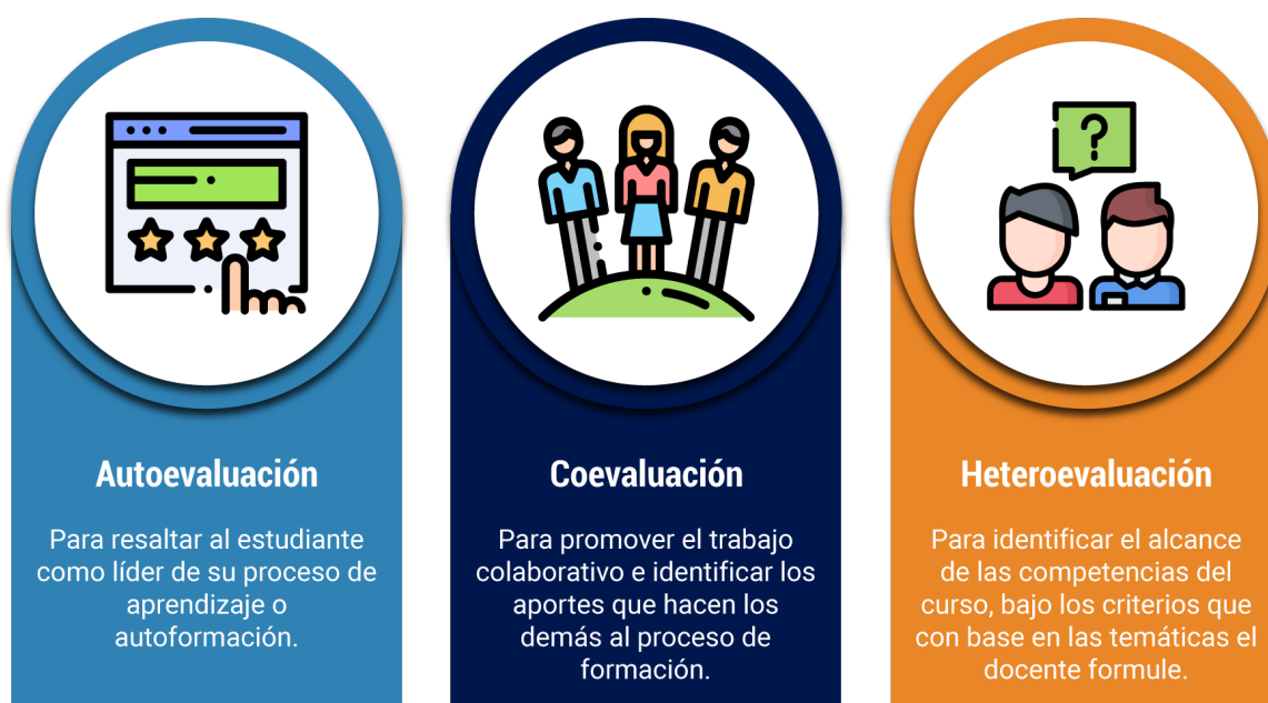
Figura 2. Tipos de evaluación. Elaboración propia

Además, la evaluación del curso se apoya en los tres tipos clásicos de evaluación: