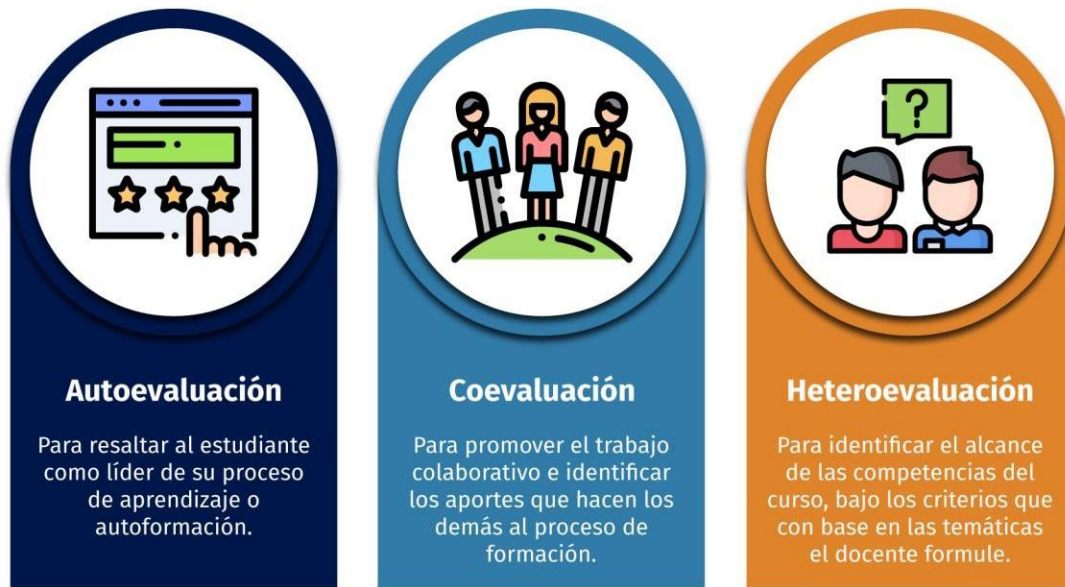
Figura 2. Tipos de evaluación, elaboración propia

Además, la evaluación del curso se apoya en los tres tipos clásicos de evaluación: