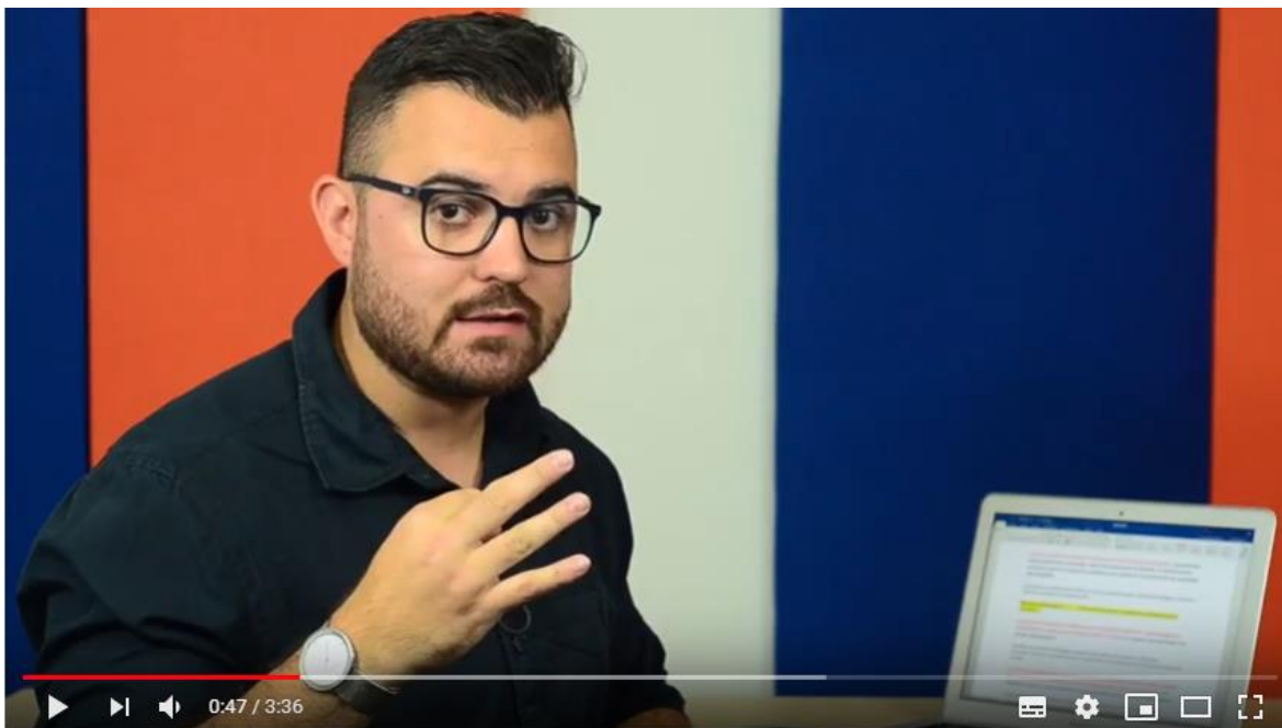
Presentación del curso